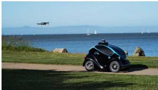
图 4 地空协同安保机器人

无人机和地面移动机器人配合，可以扩展机器人对环境感知的能力，提高机器人工作效率，见图 4。