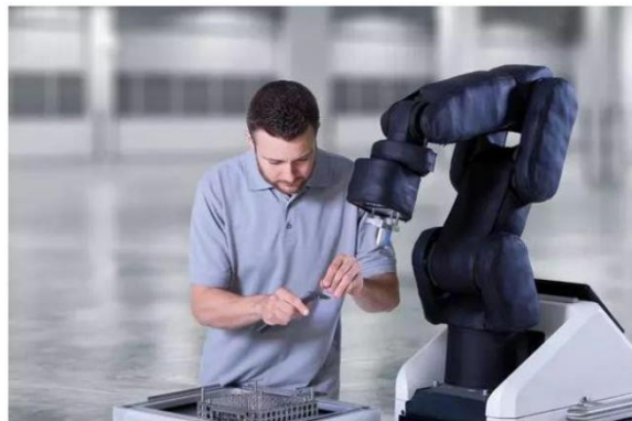
图 1 协作机器人 APAS

接触产生的非常规力，并给控制器提供一个即时反馈。同时，机器人还有安全距离保护，当检测到人靠得太近时，也会自动降低运行速度；在人离开该区域后，机器人会自动恢复正常速度，相当于隐形的防护网。