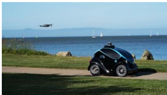
图 4 地空协同安保机器人

无人机和地面移动机器人配合，可以扩展机器人对环境感知的能力，提高机器人工作效率，见图 4。