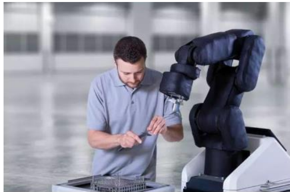
图 1协作机器人 APAS

接触产生的非常规力，并给控制器提供一个即时反馈。同时，机器人还有安全距离保护，当检测到人靠得太近时，也会自动降低运行速度；在人离开该区域后，机器人会自动恢复正常速度，相当于隐形的防护网。