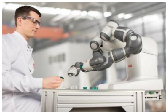
图 2双臂协作机器人 YuMi

ABB公司也有一款双臂协作型机器人，名叫 YuMi。作为一款人性化设计的双臂机器人，YuMi使小件装配等自动化作业进入一个全新时代。工人和机器人可以和谐共处，共同完成同一个任务如图 2所示。YuMi在英文中是“你和我”协同工作的简称。这样的协作系统让机器人完成制造任务中那些繁琐的重复动作，而让专业人员专注于核心需求。